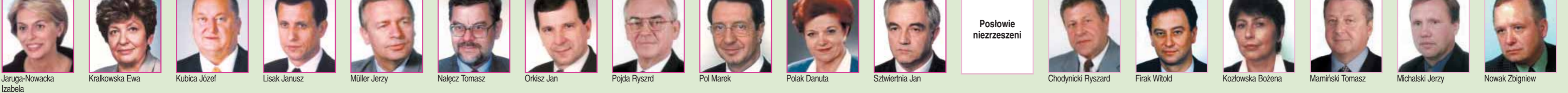
Jaruga-Nowacka Izabela, Krakowska Ewa, Kubica Józef, Lisak Janusz, Müller Jerzy, Nalecz Tomasz, Orkisz Jan, Pojda Ryszard, Pol Marek, Polak Danuta, Sztwiernia Jan, Posłowie niezrzeszeni logo, Chodynicki Ryszard, Firak Witold, Kozłowska Bożena, Mamiński Tomasz, Michalski Jerzy, Nowak Zbigniew